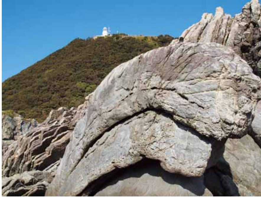
「室戸ジオパーク」平成23年9月18日（日本時間）世界ジオパークに認定