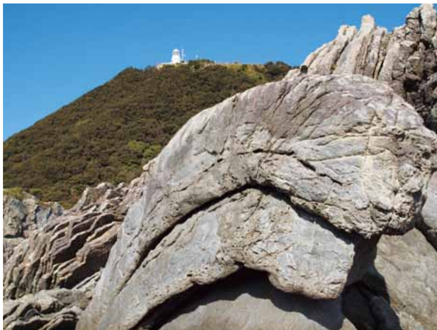
「室戸ジオパーク」平成23年9月18日（日本時間）世界ジオパークに認定