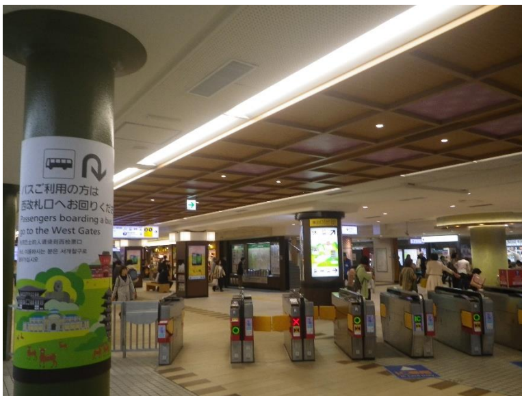
近鉄奈良駅の東改札口を出る