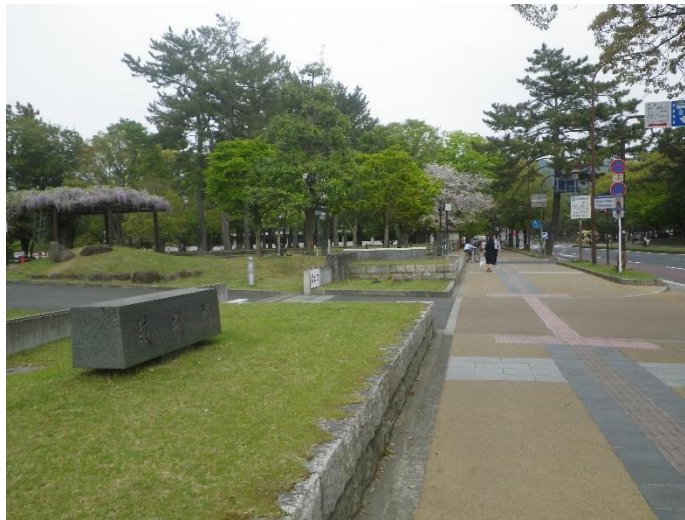
さらに奈良地方裁判所を通過し