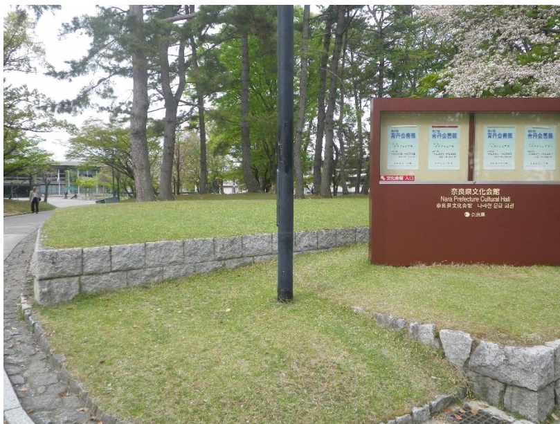
奈良県文化会館の掲示板が見えたところで左折すると、奈良県文化会館の入り口が見える。