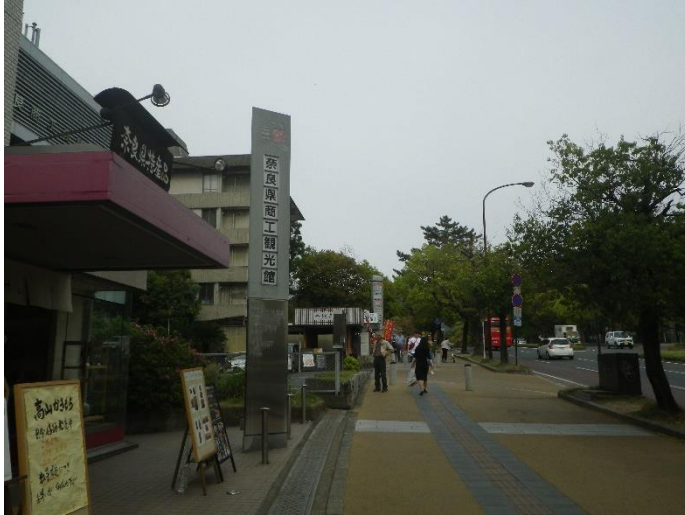
奈良県商工観光館を通過し