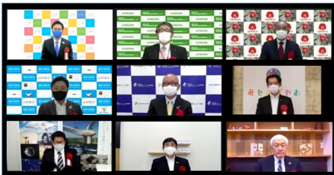
前回イノベーションネットアワード2021表彰式での受賞団体代表者及び受賞者の皆様 （オンライン形式で開催：2021年6月22日）

地域の中小企業による新事業および新産業創出などを促進し、地域産業の振興・活性化に優れた成果を上げている「地域産業支援プログラム」を表彰します。