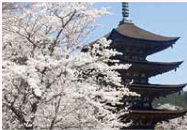
瑠璃光寺 五重の塔